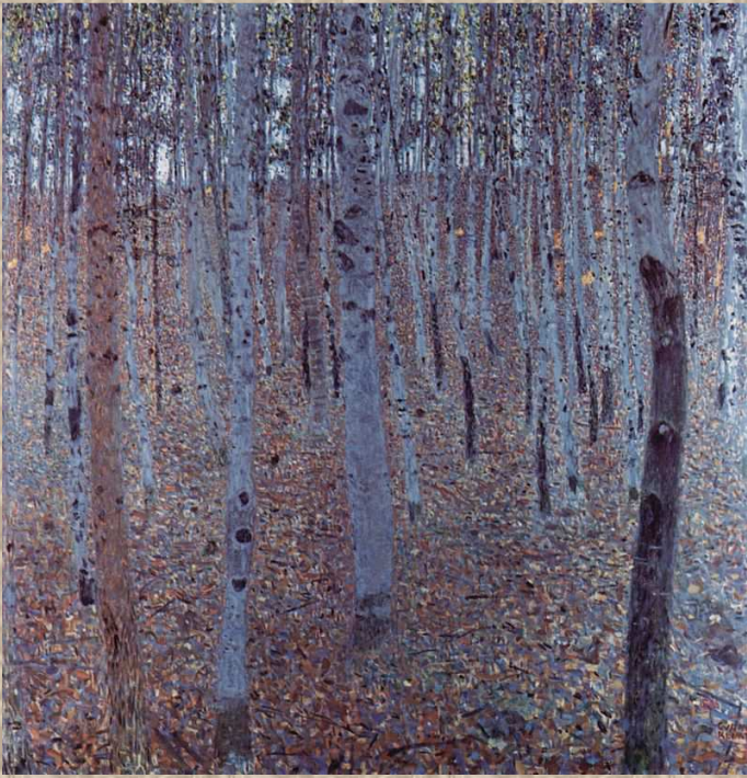
Une des sources de son inspiration, les traits longilignes des arbres, qui créèrent une de ses techniques